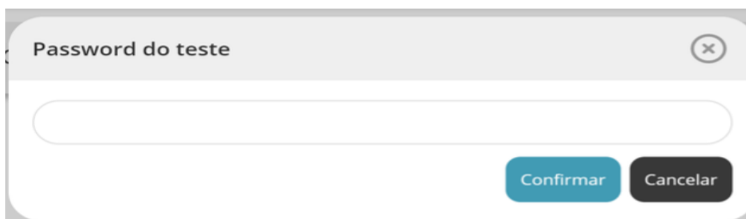
Figura 3 – Pedido da senha de acesso à prova a realizar

* Depois de aceder à prova é solicitada a senha de acesso à prova. Inserindo a senha de acesso e pressionando o botão “confirmar” a prova é iniciada.